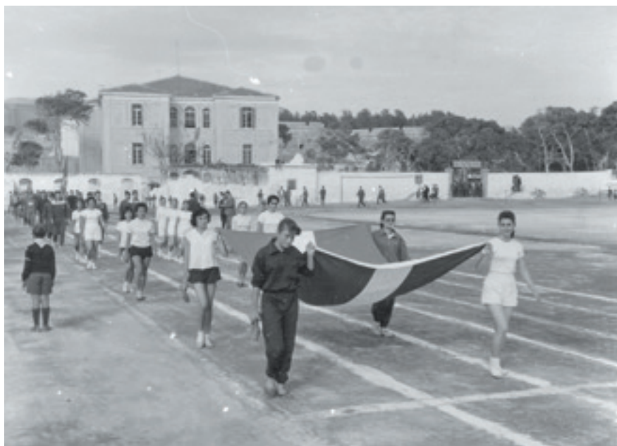
Η παρέλαση των ομάδων στην έναρξη των Αρκάδιων αγώνων του 1960 (Αρχείο Δημόσιας Κεντρικής Βιβλιοθήκης Ρεθύμνου)