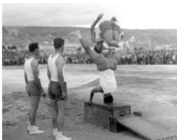
Επιδείξεις κυβίσθησης από άνδρες της ΣΕΑΠ στα Αρκάδια του 1958