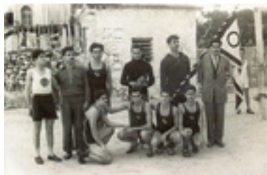
Η αποστολή της ομάδας του ΟΦΗ στα Αρκάδια του 1953