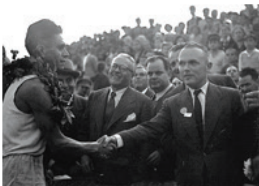
Ο πρωθυπουργός Σοφοκλής Βενιζέλος συχαίρει το νικητή του Αρκάδιου δρόμου Θ. Ραγάζο