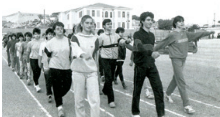
Η ομάδα του ΟΚΑ «Αρκάδι» στην παρέλαση των αθλητών/τριών στα Αρκάδια του 1987