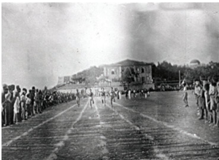
Η κούρσα των 100 μ. στα Β' Αρκαδία του 1937