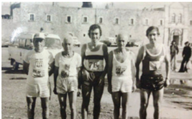
Παλαιόμαχοι αθλητές αντοχής με νεότερους αθλητές πριν την εκκίνηση του Αρκάδιου δρόμου του 1974