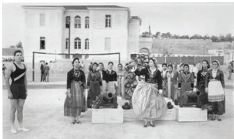
Πολιτιστικές εκδηλώσεις στα Αρκάδια του 1960 μπροστά στο βωμό που είχε μεταφερθεί στο στάδιο της Σοχώρας