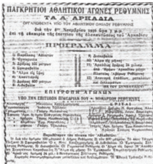
Το πρόγραμμα, η επιτροπή αγώνων και οι αθλοθέτες των Α' Αρκάδιων αγώνων