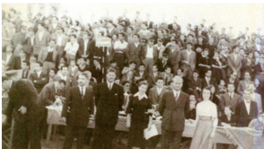
Οι θεατές στο Εθνικό Στάδιο Σοχώρας και μπροστά κριτές και επίσημοι στα Αρκαδία του 1954