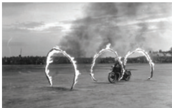
Επιδείξεις μοτοσικλετιστών της ΕΣΑ στους ΙΗ' Αρκάδιους αγώνες