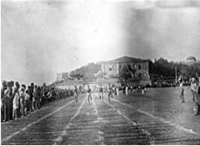
Αθλητικοί αγώνες το 1933 στο Ρέθυμνο