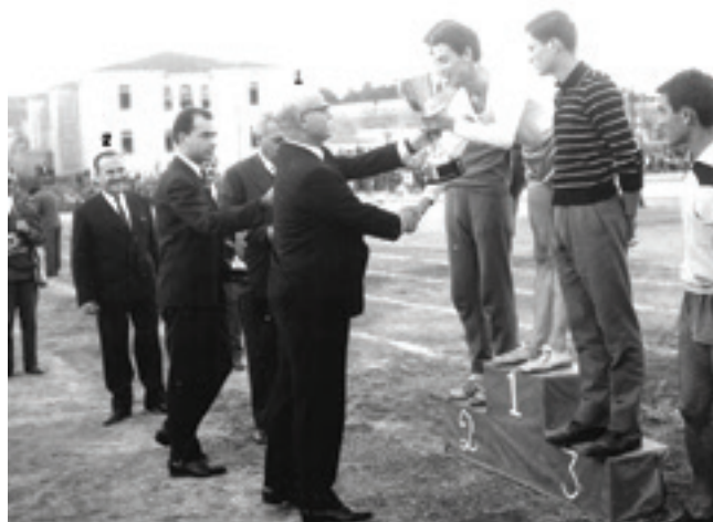
Απονομή επάθλων από τον υφυπουργό Οικονομικών Δημήτριο Αλιπράντη στους νικητές του δρόμου 800 μ. στα Αρκαδία του 1962. Διακρίνονται στο βάθος οι Κ. Γραμματικόπουλος (1ος), Αθ. Μυλωνόπουλος (2ος) και Χ. Χαραλαμπάκης (3ος) και δίπλα στον τελευταίο ο Γ. Θεοδωράκης (Αρχείο Δημόσιας Κεντρικής Βιβλιοθήκης Ρεθύμνου)