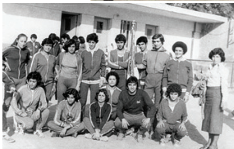
Η αποστολή της ομάδας του Κύδωνα Χανίων στα Αρκάδια του 1976