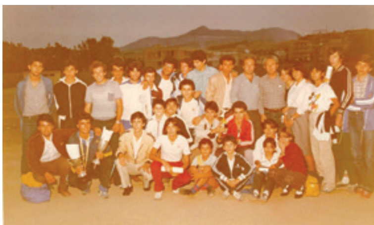
Η πολυμελής αποστολή της ομάδας του ΟΦΗ στα Αρκάρδια του 1980