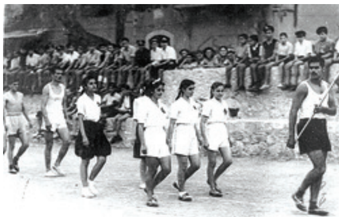
Από την παρέλαση αθλητών και αθλητριών στο στάδιο της Σοχώρας το 1948