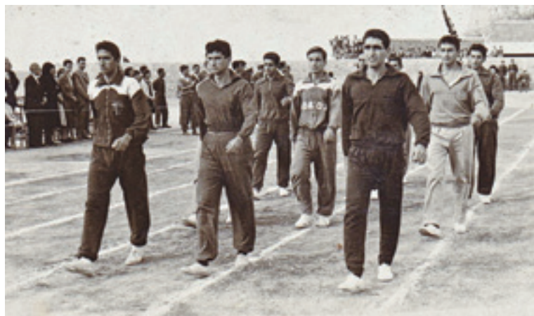
Η ομάδα του ΑΟ Ρόδου στα Κ' Αρκάδια