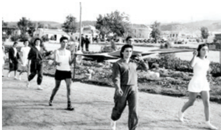
Παρέλαση αθλητριών και αθλητών στα Αρκάδια του 1956