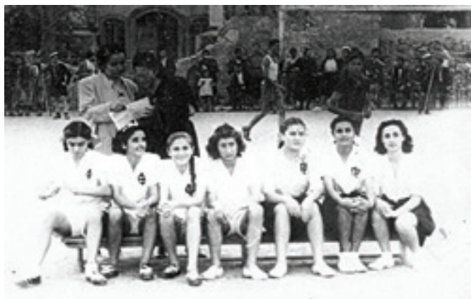
Παρέα αθλητριών του Ρεθύμνου στα Η' Αρκάδια