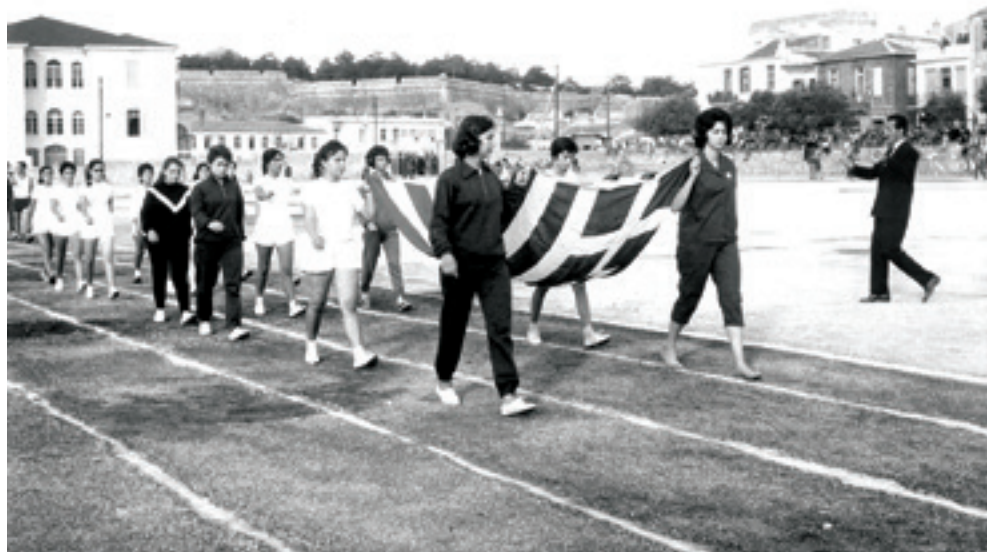
Η παρέλαση των ομάδων στα Αρκαδία του 1962