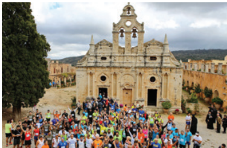
Η εκκίνηση του Αρκάδιου δρόμου το έτος 2017 (Αρχείο φωτογραφιών για τους Αρκάδιους αγώνες Περιφερειακής Ενότητας Ρεθύμνου)