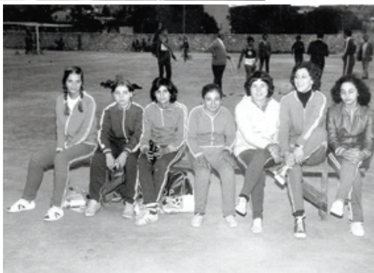
Η γυναικεία ομάδα του ΑΓΟΡ μαζί με Χανιώτισσες αθλήτριες στα Αρκάδια του 1975 (Ψηφ. αρχείο Β. Μανουσάκη)