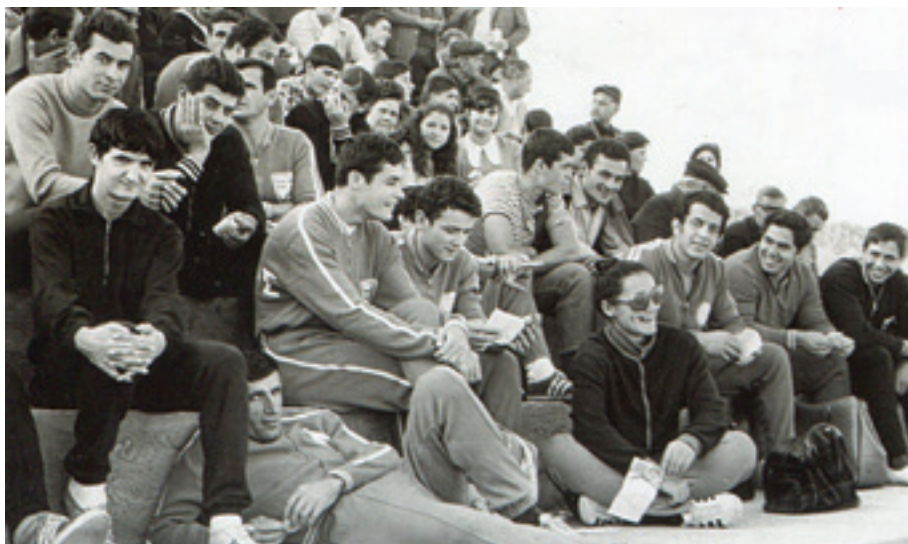
Άποψη από την κερκίδα του σταδίου της Σοχώρας στα Αρκάδια του 1970