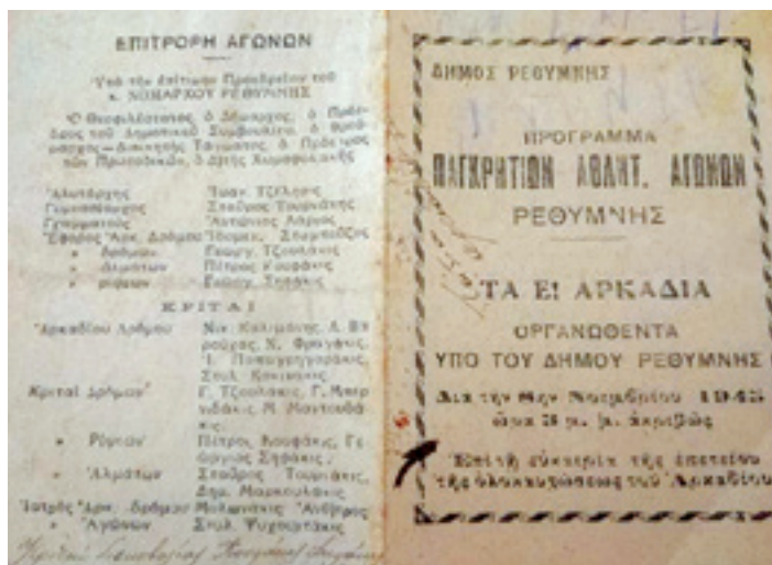
Φυλλάδιο του Προγράμματος των Ε΄ Αρκαδίων του 1945

επιτυχία των αγώνων και την προσπάθεια των αθλητών που απέδειξαν «ότι είναι απόγονοι άξιοι των προγόνων τους» και συνεχιστές τους «εις όλα τα πεδία των αγώνων». 49