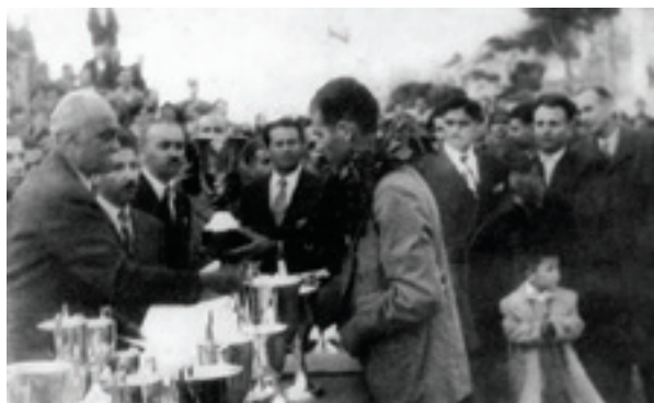
Ο πρωθυπουργός Ν. Πλαστήρας απονέμει το έπαθλο του νικητή του Αρκάδιου δρόμου στον Β. Τριανταφύλλου το 1951